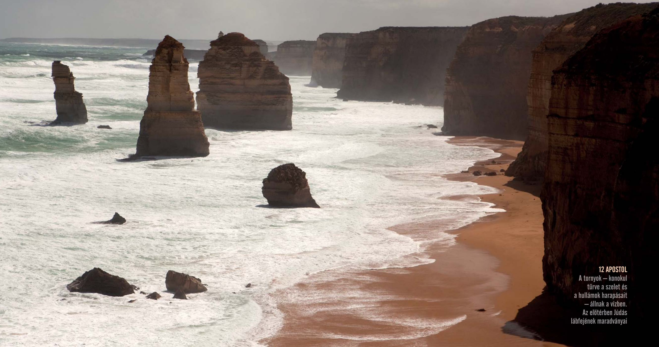
12 APOSTOL A tornyok – konokul tűrve a szelet és a hullámok harapásait – állnak a vízben. Az előtérben Júdás lábfejének maradványai